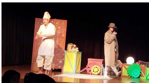
Teatro Infantil "Uma Aventura de Natal"