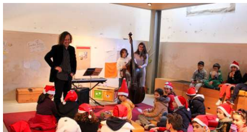
ConcentusPerTempora-Ensemble "Das Tendas no Alto da Ajuda ao Douro Vinhateiro"