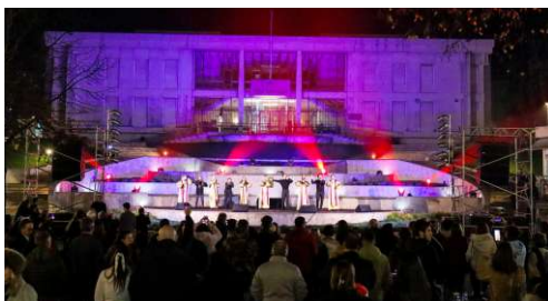
Atuação do grupo GoGospel