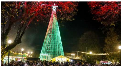
Inauguração das Luzes de Natal