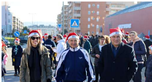
Livre de Ser Saudável MARCHA SOLIDÁRIA