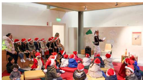
Histórias com Música "Alberto e a Árvore de Natal"