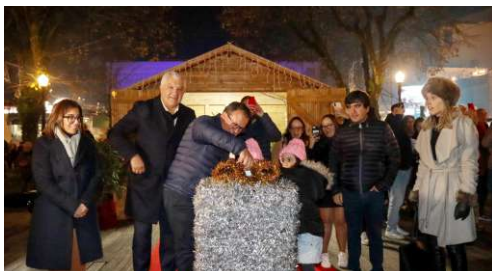
Inauguração das Luzes de Natal