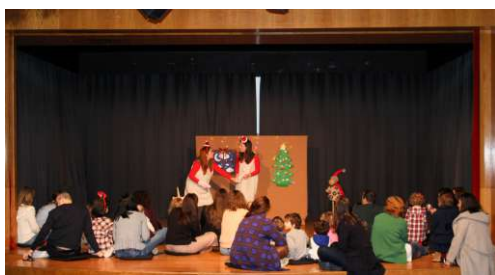
Teatro Infantil "A Rena de Mil Cores"