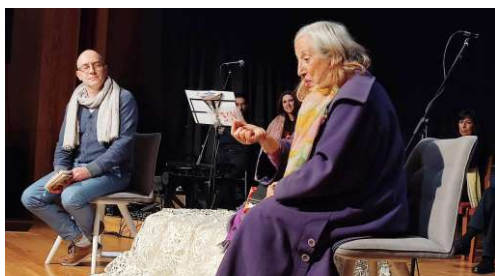
(In)quietude das Palavras Saramago, o Homem por detrás das palavras!