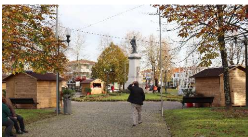
Mercado de Natal