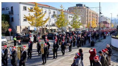
Livre de Ser Saudável MARCHA SOLIDÁRIA