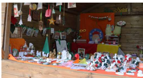
Mercado de Natal