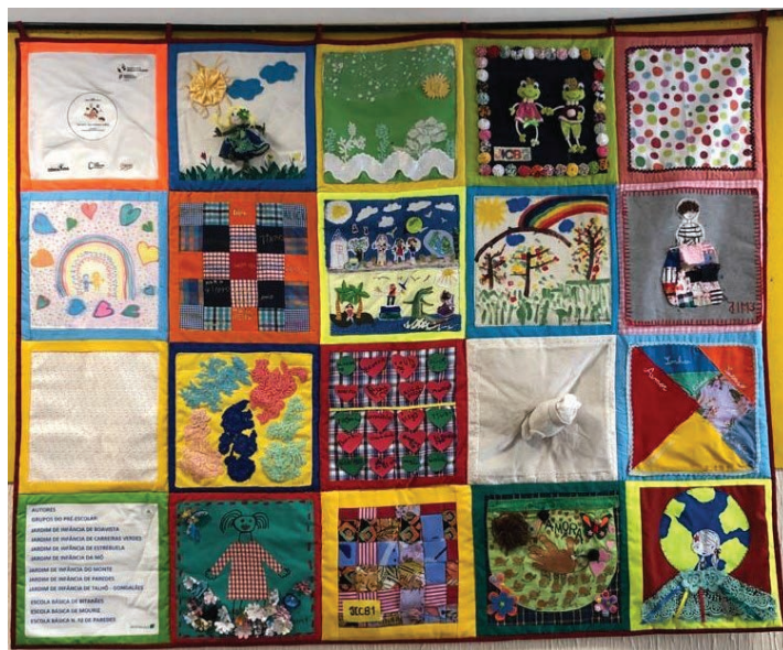
TEXTO E IMAGEM BÁRBARA ALMEIDA

https://ewwr.eu/actions-db/?filter_country_and_regions=portugal-regiao-do-vale-do-sousa