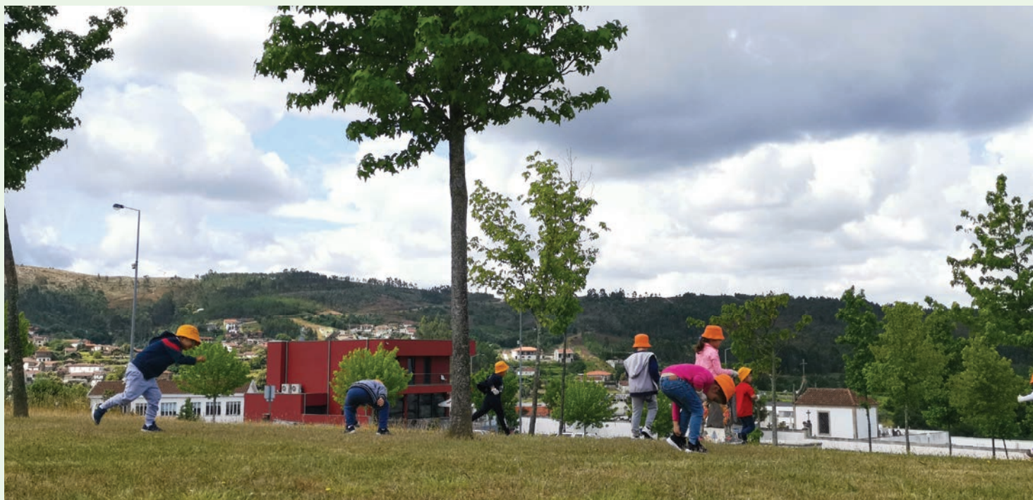
TEXTO E IMAGEM AMBIENTE PAREDES

Cabe ainda espaço de agenda para os “Encontros com o Parque” iniciando a dia 24 de maio com muitas atividades de divulgação e promoção do Parque das Serras do Porto.