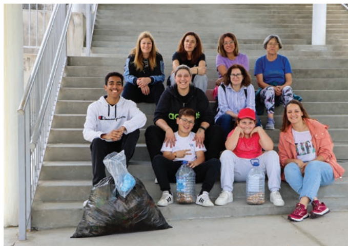
TEXTO E IMAGEM GRUPO PLOGGER PAREDES

Estamos muito gratos pelo Grupo Plogger Paredes ser convidado para a dinamização de um workshop na segunda edição das Jornadas do Ambiente, realizadas em Lordelo. Sem dúvida, uma experiência incrível e gratificante para nós, conseguir contagiar mais pessoas a terem interesse por colocar este conceito em prática, ao terem participado na atividade dinamizada por nós e perceber pelas reações dos participantes, que o desenvolveram com uma enorme satisfação, ficando rendidos à atividade.