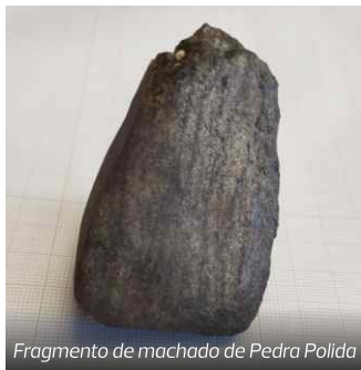
Fragmento de machado de Pedra Polida

Trilogia: Uma peça | Um documento | Um livro