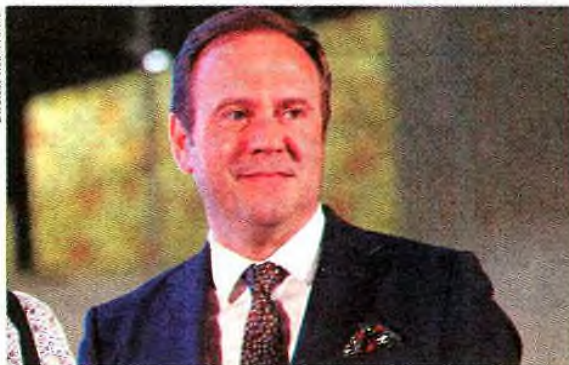
JOSÉ LUÍS MADEIRAS FOI UMA DAS EMPRESAS PREMIADAS

empresas vencedoras foram a Semalha, na categoria de Mulheres de Sucesso; a Luís Silva Estofos, na categoria de Geração Gold | Geração Empreendedora; a Albino & Faustino, na categoria Fornecedores à Indústria – Madeiras e Derivados; e a José Luís Madeiras, na Geração Empreendedora.