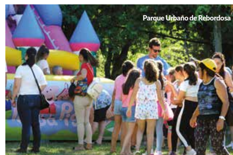
Parque Urbano de Rebordosa