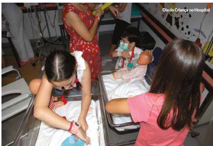
Dia da Criança no Hospital

Durante a manhã de sábado, no corredor e na sala de formação junto à entrada da Pediatria, as crianças tiveram à sua disposição bancas com material adequado para poderem "brincar aos hospitais", pintar t-shirts, pinturas faciais e modelagem de balões realizada por alunos do Ensino Básico.