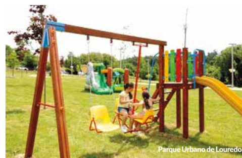
Parque Urbano de Louredo

A iniciativa contou ainda com uma aula de Pilates, um momento musical proporcionado pelo grupo Amigos da Pediatria e um insuflável que fez as delícias da pequenada.