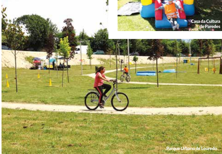
Parque Urbano de Louredo