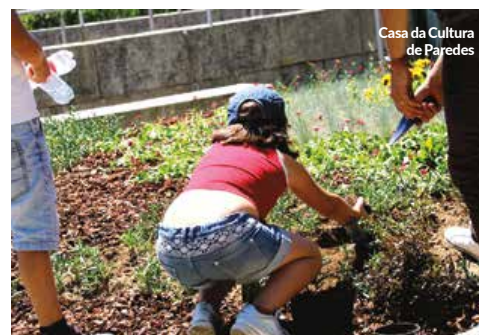
Casa da Cultura de Paredes