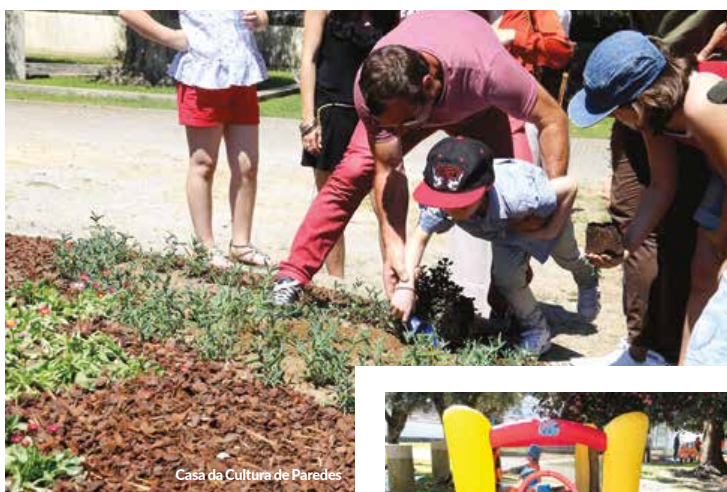
Casa da Cultura de Paredes