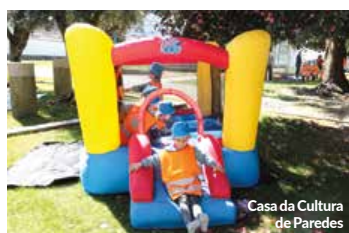
Casa da Cultura de Paredes