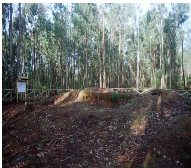
(Mamoas de Brandião)

Mamoas de Brandião é um testemunho funerário pré-histórico. É uma monumentalidade bem visível no território que serviu como marco no limite de propriedade e denominação local nas inquirições de 1258 e no Tombo da Mesa Abacial do Mosteiro de Paço de Sousa de 1651.