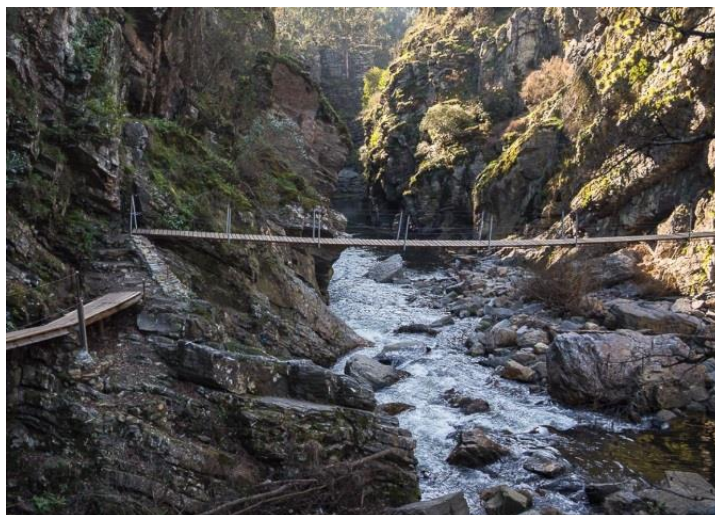
(Parque Nossa Senhora do Salto)

O Parque da Nossa Senhora do Salto, talvez seja das zonas mais apreciadas do nosso concelho. Está localizado entre serras por onde passa o Rio Sousa. Neste local os visitantes podem usufruir da natureza com a prática de rappel , escalada, BTT ou caminhadas pedestres. Este lugar está envolvido numa lenda, em que um cavaleiro escapou à morte ao invocar a proteção da Senhora após um salto inadvertido para o abismo. Em sinal do agradecimento pelo milagre acontecido, o cavaleiro terá mandado construir a pequena Capela da Nossa Senhora do Salto.