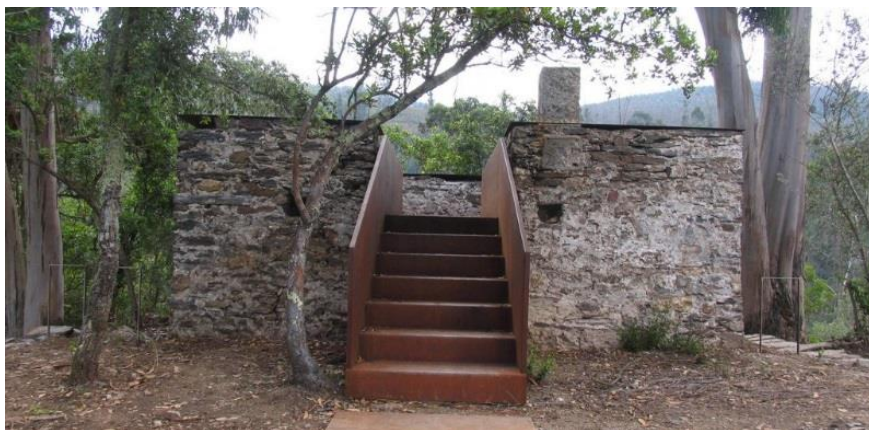
(Torre do Castelo de Aguiar de Sousa)

A Torre do Castelo de Aguiar de Sousa foi algo que foi construído posteriormente ao antigo Castelo de Aguiar. De acesso difícil o antigo Castelo situava-se na rede defensiva do território, a que os reis Asturianos deram particular atenção nos séculos IX e X. A partir do século XI torna-se cabeça de Terra de Aguiar dominada pelos Sosas ou Sousões, convertendo-se em 1258, no centro administrativo judicial do “Julgado de Aguiar de Sousa”, um dos mais poderosos da região. Do Castelo ficaram visíveis restos de uma torre de planta quadrilátera, irregular, de construção em alvenaria de xisto e quartzito. Classificado como Monumento de Interesse Público a 20 de setembro de 2012 e integrado na Rota do Românico, foi objeto de trabalhos de conservação e valorização. Os trabalhos arqueológicos revelaram a muralha primitiva com 150 cm de largura e exumaram-se objetos que faziam parte da vida quotidiana dos Homens do castelo, tais como, fragmentos de cerâmica de uso doméstico e uma ponta de seta das atividades bélicas ou de caça. Estes trabalhos fizeram com que a Torre se transformasse numa espécie de miradouro. As pessoas que a visitam têm assim acesso às vistas da natureza.