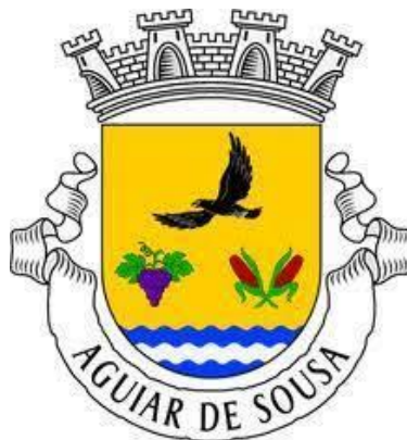
(Brasão Junta de Freguesia Aguiar de Sousa)

A freguesia de Aguiar de Sousa é uma freguesia com uma área de 22,4 km 2 que faz fronteira com as freguesias de Recarei e Sobreira, do concelho de Paredes e com freguesias do concelho de Gondomar.