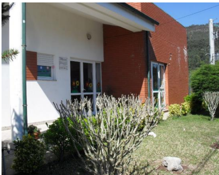
(Jardim de Infância de Pulgada)

A nível educativo, a freguesia possui o Jardim de Infância de Pulgada, agrupado ao Agrupamento de Escolas de Sobreira (Rua da Ucha, nº112 4585-005 Telefone 224 501 091 / ji.pulgada@agsobreira.org ),