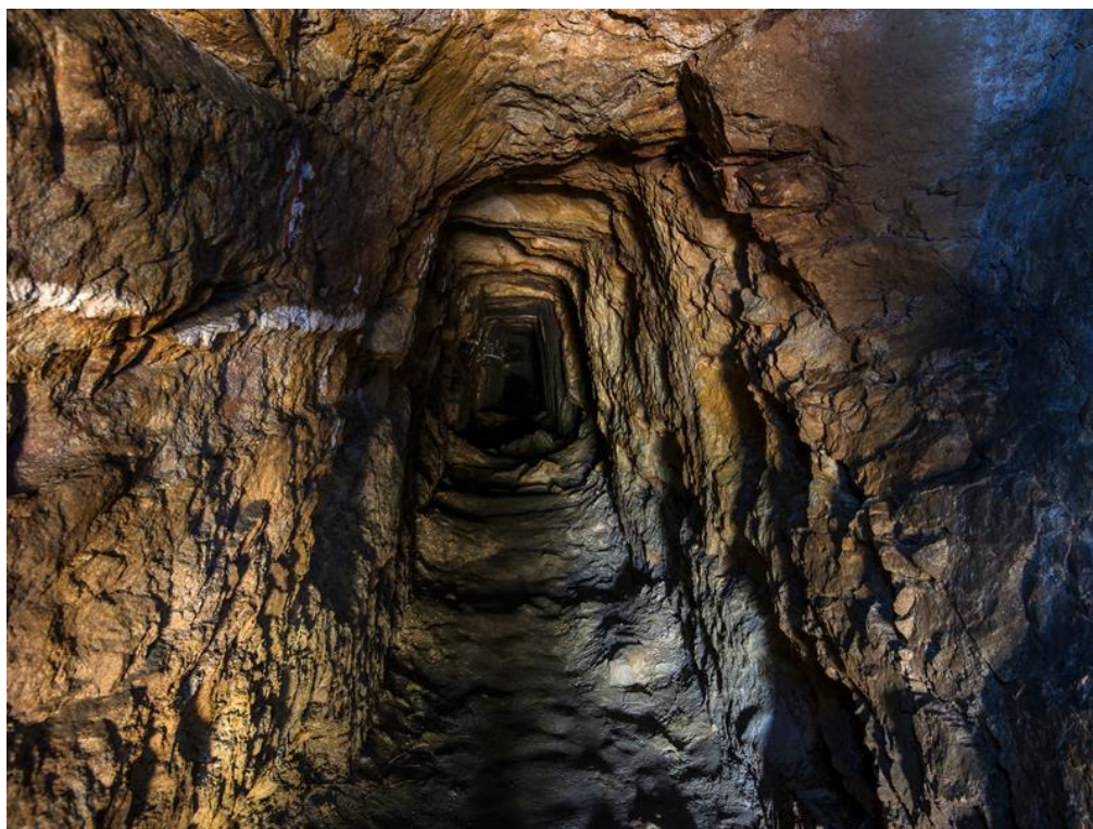
Minas de Ouro de Castromil e Banjas