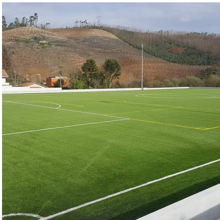
Complexo Desportivo da Sobreira