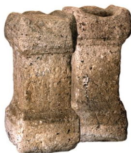
Aras de Santa Comba