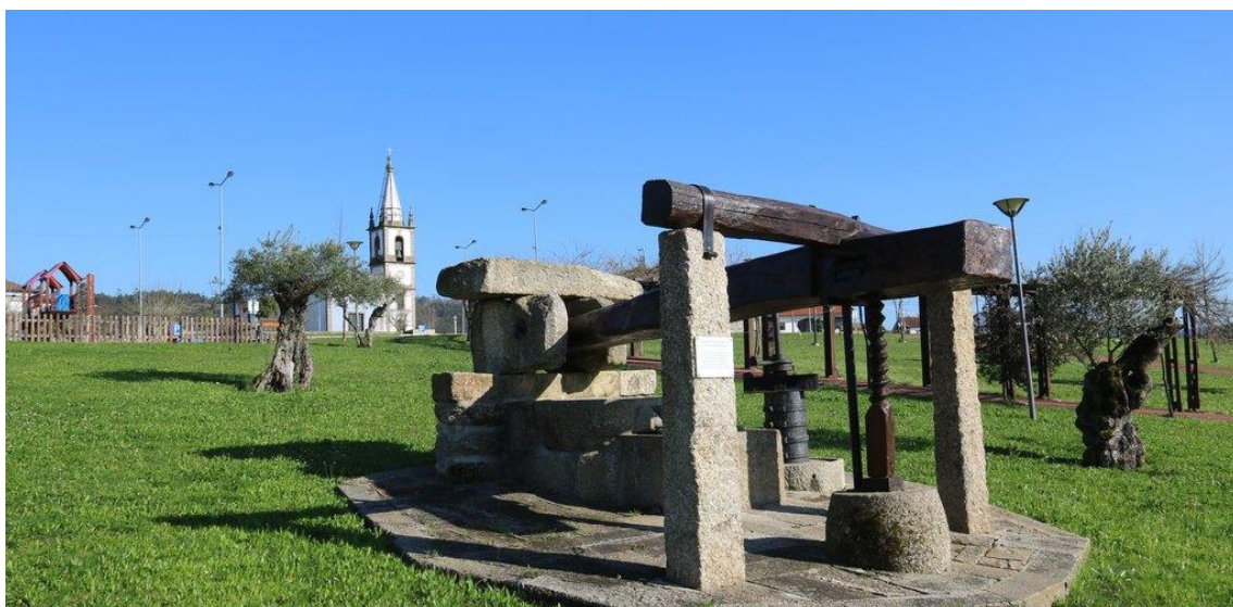
Alameda de S. Pedro