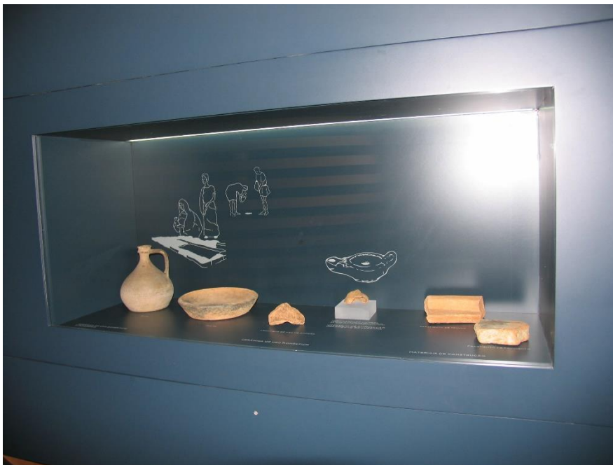
Centro de Interpretação das Minas de Ouro de Castromil e Banjas