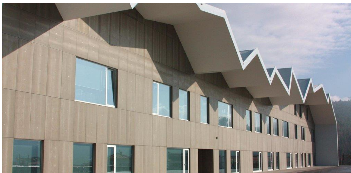
Centro Escolar da Sobreira