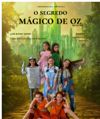
Organização: Emotiondance | Apoio: Câmara Municipal de Paredes