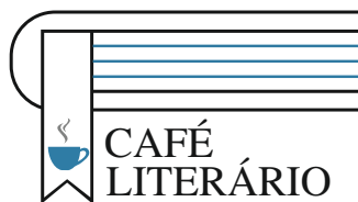
Organização: Câmara Municipal de Paredes