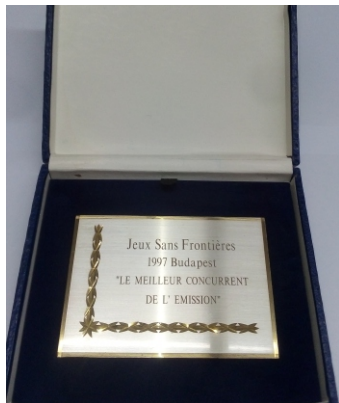
Organização: Câmara Municipal de Paredes

Trilogia: Uma peça | Um documento | Um livro