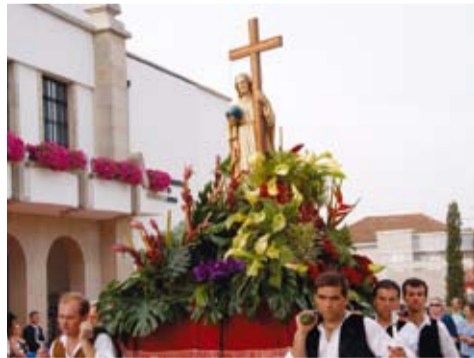
DIVINO SALVADOR - CASTELÕES DE CEPEDA