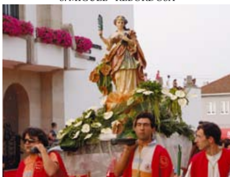
STA. EULÁLIA - VANDOMA