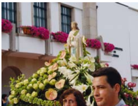
STA. MARINHA - ASTROMIL