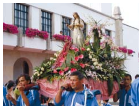
STA. MARIA MADALENA - MADALENA