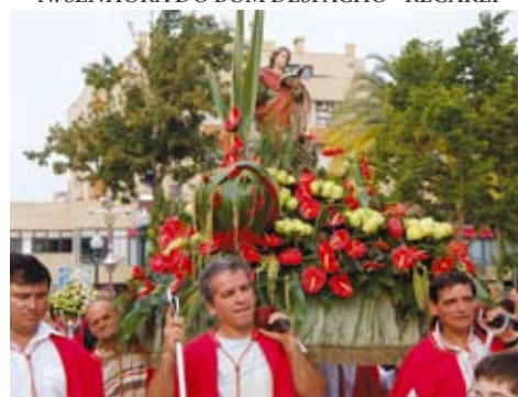
S. JOÃO EVANGELISTA - VILA COVA DE CARROS