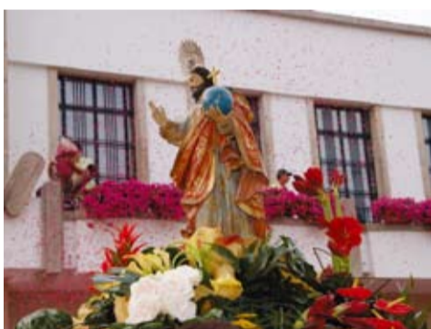
DIVINO SALVADOR - LORDELO