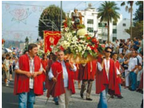
S. MIGUEL - CRISTELO