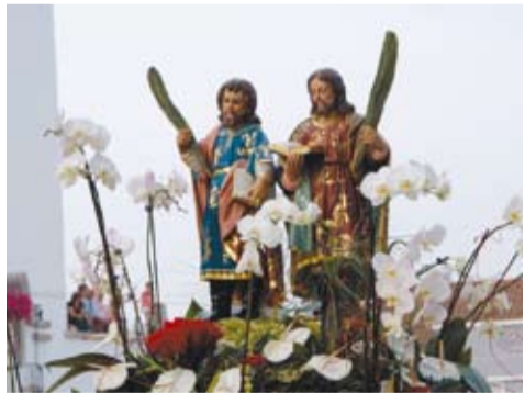
S. COSME E S. DAMIÃO - BESTEIROS