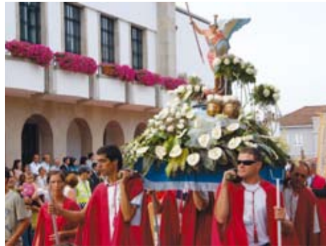
S. MIGUEL - GANDRA