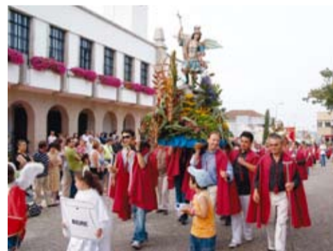
S. MIGUEL - BEIRE