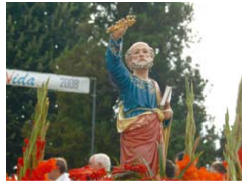
S. PEDRO - CETE