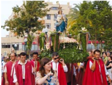
NOSSA SENHORA DO Ó - DUAS IGREJAS