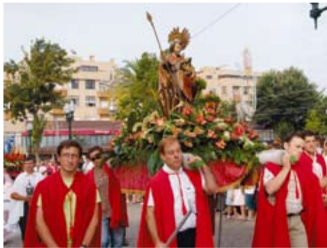
S. TOMÉ - BITARÃES