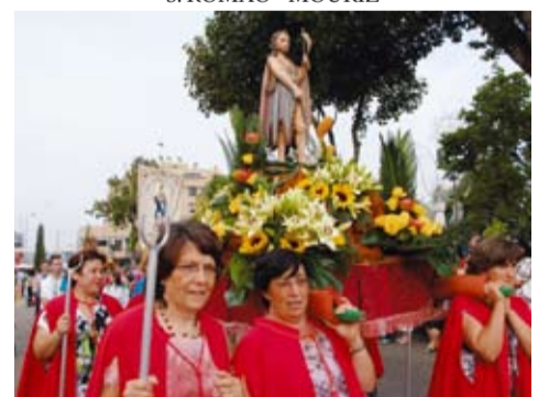
S. JOÃO BAPTISTA - SOBREIRA