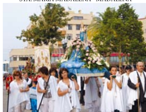
N. SENHORA DO BOM DESPACHO - RECAREI