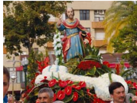
S. PEDRO - GONDALÃES