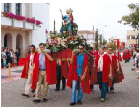
S. CRISTOVÃO - LOUREDO