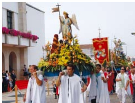
S. MIGUEL - BALTAR